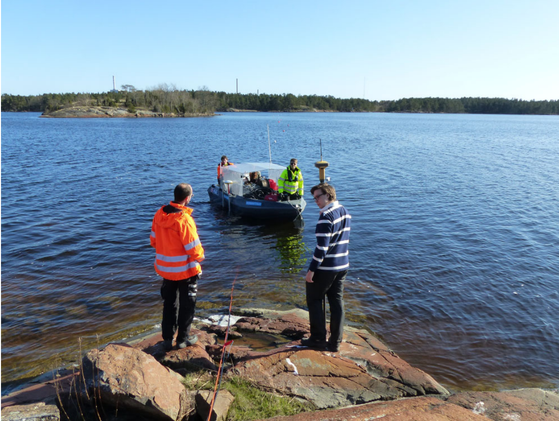
Figur 3. Fältförsök med kombinerad resistivitets- och seismikmätning tvärs en vattenpassage vid Äspö berglaboratorium.